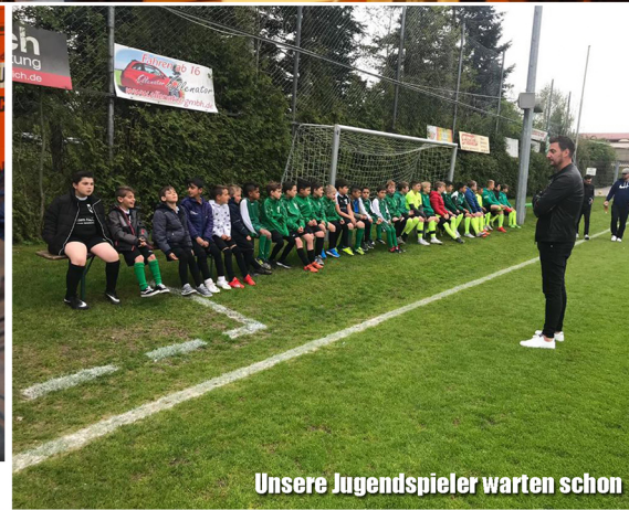
Unsere Jugendspieler warten schon