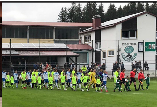
Nach der Eröffnung spielte unsere 1. Mannschaft noch gegen Kissing und gewann 6:1. Möge dieses Glück des heutigen Tages für immer und ewig auf unserer Seite stehen.

Auf den folgenden Seiten findet ihr zu den Berichten unserer Jugend immer wieder kleine Geschichten oder Bilder aus unserem Museum. Fragen zu den Bildern tauchen auch auf. Die Antworten dazu, findet ihr im BSK Museum.